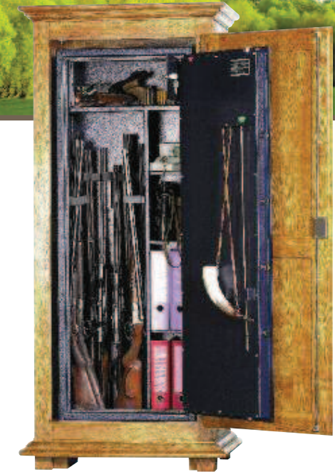
Modèle WT 314.