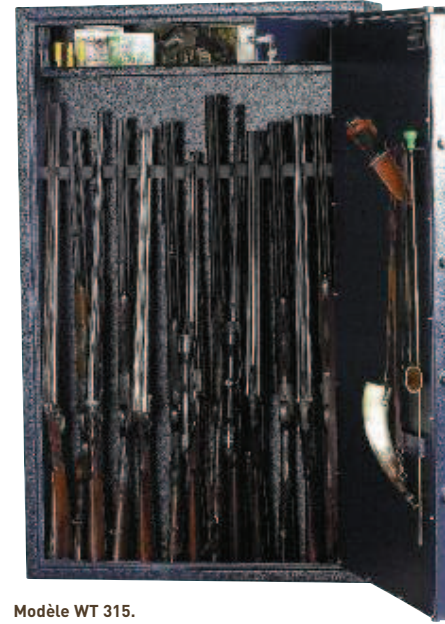
Modèle WT 315.