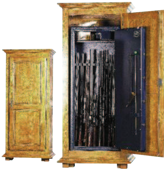
Modèle WT 310 (présenté dans son meuble en chêne massif).