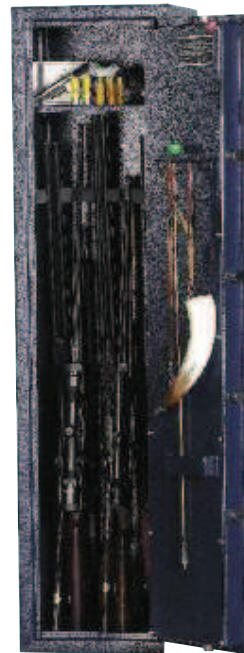
Modèle WT 306.